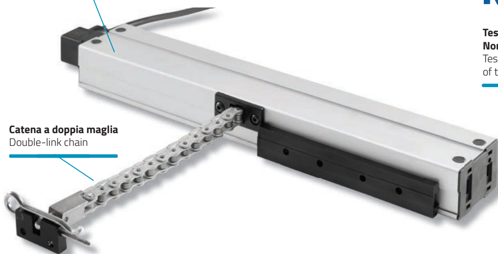
Catena a doppia maglia Double-link chain

Testato in base alle specifiche della Normativa Europea EN 12101 - 2 Tested in accordance with the requirements of the European Standard EN 12101 - 2